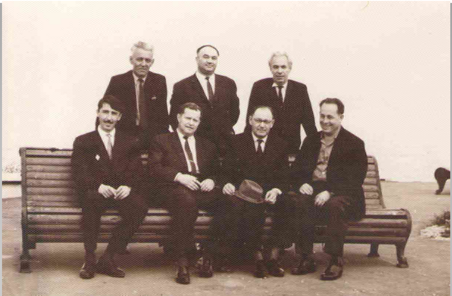
Г.А. Бердичевский с директорами заводов электротехнической промышленности. 1963г.